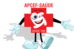
TABELA DE VALORES